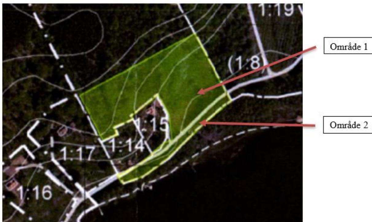
Bild 1. Marken som enligt överenskommelsen skulle överföras från skogsbruksfastigheten XXX till bostadsfastigheten YYY. Mark- och miljööverdomstolen har markerat de områden som i domen benämns 1 och 2.

Parterna ingick i oktober 2018 en skriftlig överenskommelse om fastighetsreglering innebärande att CJ skogsbruksfastighet XXX skulle avstå ca 1,8 ha mark till PB och IB (i fortsättningen PB och IB) bostadsfastighet YYY. Av den kartskiss som bifogades överenskommelsen framgick att marken som skulle föras över bestod av två områden, skilda åt av en samfällad väg; område 1 om ca 1,6 ha som omfattar del av XXX norr om den samfällda vägen och område 2 som omfattar all mark tillhörig XXX söder om samma väg, se bild 1. Det framgick även av överenskommelsen att PB och IB skulle betala 300 000 kr till CJ i ersättning för marköverföringen och att de skulle stå hela förrättningskostnaden.